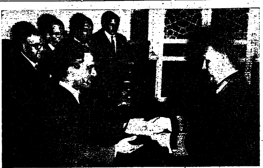
جلالة الملك العظيم يقطن اوراق اعتماد السفير السوفياتي الجديد بحضور سيادة رئيس الديوان الملكي ووزير الخارجية وسيادة كبير الامراء والامين العام للديوان الملكي